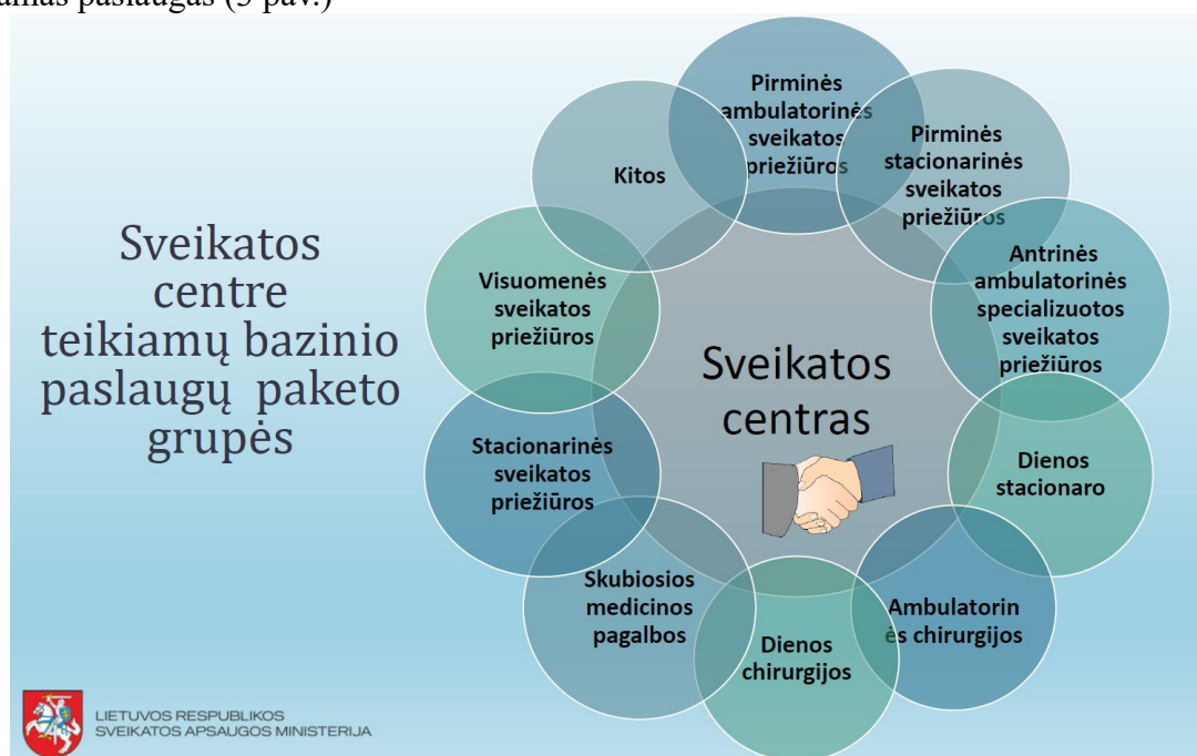
3.pav. Sveikatos centro teikiamų bazinių paslaugų grupės.

Sveikatos centras teikia Lietuvos Respublikos sveikatos apsaugos ministro 2023 m. gegužės 22 d. įsakyme Nr. V-589 „Dėl Sveikatos centrui priskiriamų sveikatos priežiūros paslaugų teikimo organizavimo tvarkos aprašo patvirtinimo“ (toliau – Įsakymas) nustatytas bazines Sveikatos centrui priskiriamas paslaugas (3 pav.)