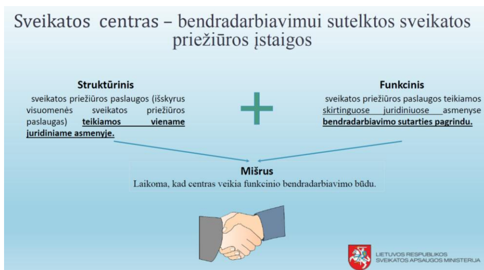
1 pav. Sveikatos centro veikimo modelis. Informacijos šaltinis: LR SAM.

Sveikatos centras – tai tarpusavyje bendradarbiaujančių ir atskirais juridiniais asmenimis veikiančių asmens sveikatos priežiūros įstaigų (toliau – ASPĮ) tinklas, užtikrinantis savivaldybei priskirtų būtinųjų sveikatos priežiūros paslaugų teikimą (1 pav.).